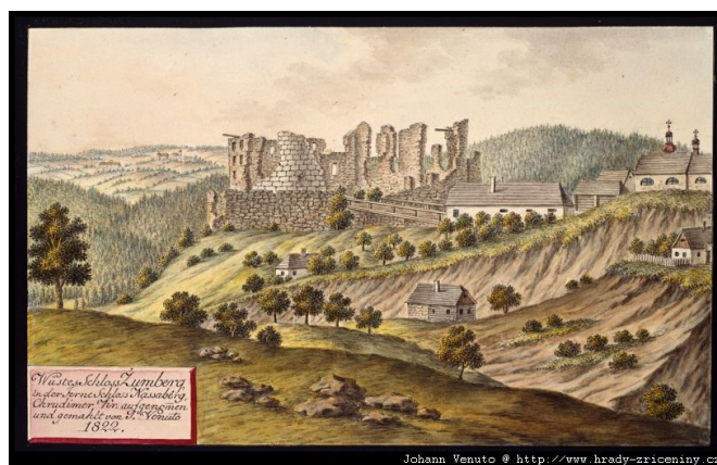
stav hradu k r. 1822